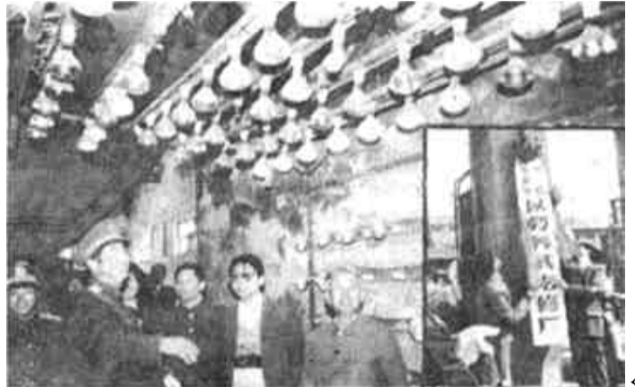
东营区海河路办事处人武部最近开设了一家“以劳养武汽修厂”，所得利润将全部用于民兵预备役建设，受到军分区领导的高度赞扬。（本报记者 摄）

渡口赌场何时休？ 去年10月本报曾刊登过一位读者的来稿，反映他从利津到垦利时在渡船上看到有人利用博手法骗钱，今天又一位读者反映刘家夹河渡口的这种现象。渡口处这种活动至今不绝，何也？是管的部门没去管、没管住？是有的单位人员本身与染社会风气的丑恶现象，并请广大群众切勿上当。（毓环）